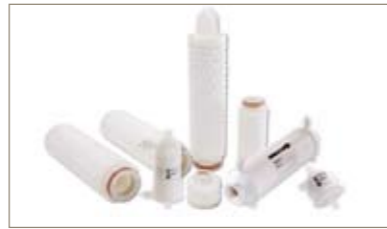
PROCLEAR PP -全聚丙烯材质过滤器，化学兼容性好，适用于腐蚀性溶剂过滤