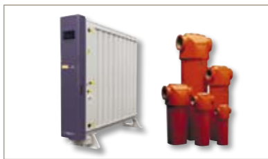
从常规的不锈钢滤壳到化学兼容性更强的Alloy22、PTFE，都符合PED/ASME和ATEX94/91/EC认证要求。派克拥有诸多系列的滤壳产品可供选择