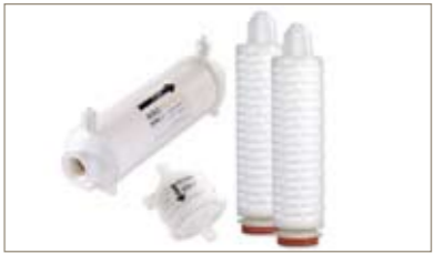
PROPOR SG-PES 滤膜材质具有流量大、使用成本低的特点，适用于医药产品的除菌过滤