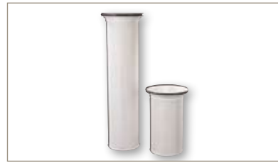
PB系列折叠滤袋 -使用成本低，截留率更高