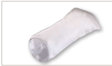
滤袋 -经济高效的溶液澄清过滤产品