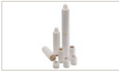
PROSPUN A -无纺布聚丙烯过滤器，使用成本低，持续高效除去颗粒杂质 PEPLYN PLUS -折叠式聚丙烯过滤器，颗粒截留率更高 TETPOR LIQUID -适用于腐蚀性溶剂的澄清过滤和降低生物负荷 TETPOR PLUS -全含氟聚合物的结构，更高的抗腐蚀性，适用于绝大多数的腐蚀性溶剂