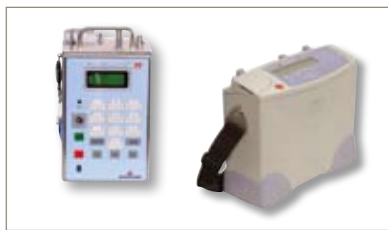
PROCHECK IV -可进行过滤器完整性测试，包括水侵入、压力衰减、泡点测试